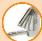
15" LCD-Monitor schwenkbar

Verbessert die Kontrastauflösung und Bildqualität durch Trennung der Basisfrequenz und Harmonieinhalt